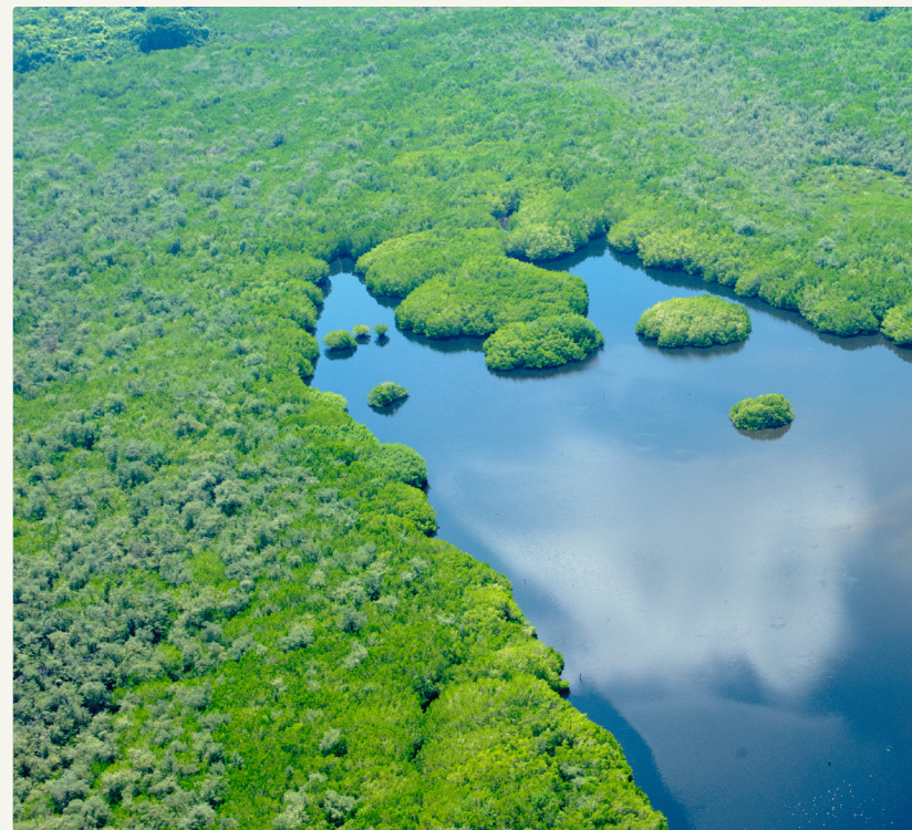
Lagunas y manglares en la Reserva de la Biosfera Marismas Nacionales, Nayarit, México.

Este análisis identificó 189 cuencas con factibilidad para establecer reservas de agua (Mapa 1, al reverso) y que serán el objetivo principal de un Programa Nacional de Reservas de Agua , cuyos objetivos son: i) establecer un sistema nacional de reservas de agua; ii) demostrar los beneficios de las reservas de agua como instrumento garante de la funcionalidad del ciclo hidrológico y sus servicios ambientales; y iii) fortalecer las capacidades para la aplicación de la norma de caudal ecológico en todo el país.