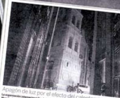
Apagón de luz por el efecto del calentamiento global. La organización internacional Fondo Mundial para la Vida Silvestre (WWF) por su sigla en inglés, La Planeta, llevó adelante una campaña con el objetivo de "Dar un respiro al planeta" durante la noche del sábado 28 de marzo de 2009 en el mundo. En Santa Cruz, el total que 2.800 ciudades en el mundo participaron para convencer a los ciudadanos de 200 millones de personas de apagar las luces en el Cristo Redentor y la Avenida Motovator Rivera durante una hora. Participaron autoridades locales y nacionales.