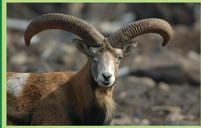
Նոյնական մուֆլոն Armenian mouflon (Ovis orientalis gmelini)