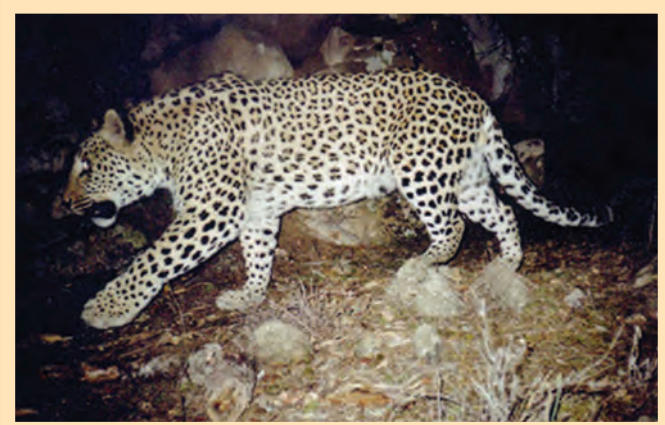
Կովկասյան ընձույղ Caucasian leopard (Panthera pardus caucasica)