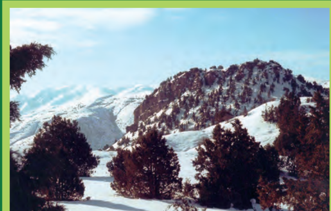
«Խոսրովի անտառ» պետական արգելոց “Khosrov Forest” State Reserve