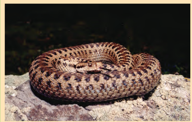
Դարեկյի իծ Darevsky's viper (Vipera dorevskii)