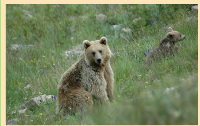
Գորշ արջ Brown bear (Ursus arctos)

“AREVIK” National Park Planned Area: about 29,000 ha, it will include “Boghakar” Sanctuary Purpose: protection of landscape and biological diversity, endemic, rare and endangered species, their habitats, natural and historical heritage of the “Boghakar” Sanctuary, typical mountainous floristic zones of the Meghri and Zangezur ridges; conservation of the Caucasian leopard, beazar goat, Armenian mouflon (Zangezur Ridge), brown bear, Caucasian otter, Caspian snowcock, Caucasian black grouse, Armenian viper and others Biodiversity: about 1500 species of vascular plants including 24 registered in the RDBA and 19 endemics; about 245 species of vertebrate animals including 49 registered in the RDBA and 12 - IUCN Red List