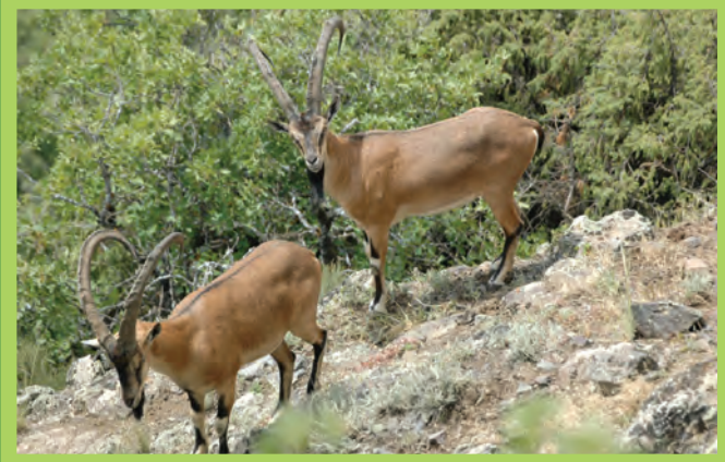
Բեզարյան այծ Bezoar goat (Capra caucasus)