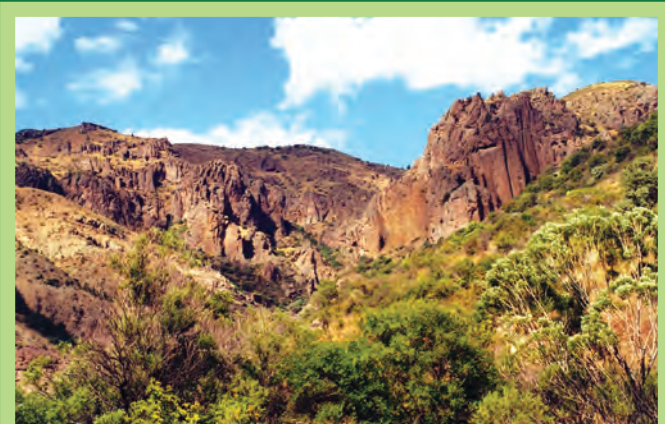
«Խոսրովի անտառ» պետական արգելոց “Khosrov Forest” State Reserve