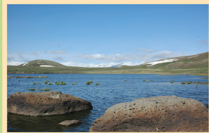
«Արփի լիճ» ազգային պարկ (պլանավորված) “Lake Arpi” National Park (planned)