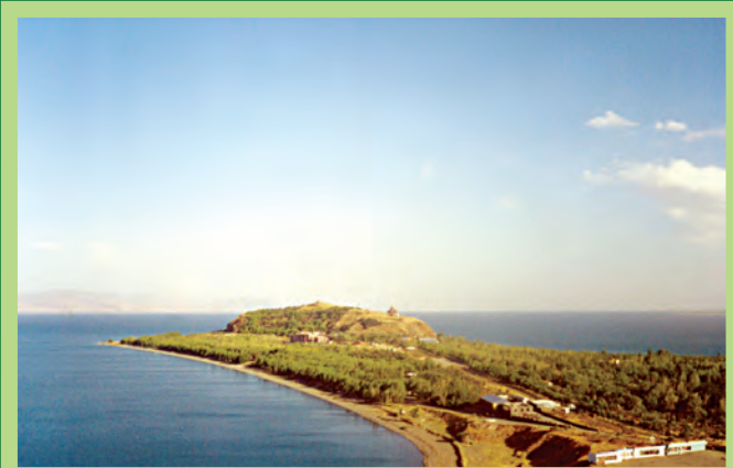
«Սևան» ազգային պարկ “Sevan” National Park

«ԽՈՍՐՈՎԻ ԱՆՏԱՐ» պետական արգելոց Ստեղծվել է՝ 1958 թ. Տարածքը՝ 23878 հա Բարձրությունը՝ 700-2800 մ ծովի մակարդակից բարձր Նպատակը՝ չոր, նոսրանտառային, ֆրիգանային և կիսանախապտային (անոշաֆունների, բուսական և կենդանական եզակի համակենցողությունների պահպանություն, կովկասյան ընձույղների, բեզարյան այծի, գորշ արջի, սև սննդի կասպիական հնդկախավի, հայկական իծի և այլ տեսակների պահպանություն Կենսաբազմազանությունը՝ 1849 տեսակ անողնալոր բույսեր (Պայաստակի ֆլորայի 50%-ից ավելի), ներառյալ 24 էնդեմներ և 349-ում գրանցված ավելի քան 80 տեսակ, 283 տեսակ որկաշարավոր կենդանիներ, ներառյալ 349-ում գրանցված ավելի քան 50 տեսակ և ԲՊՄՄ Կարմիր ցուցակում գրանցված 11 տեսակ