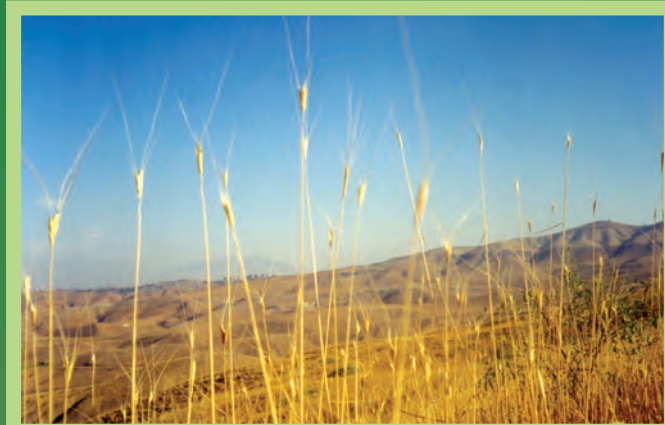
«Էրեբունի» պետական արգելոց “Erebuni” State Reserve