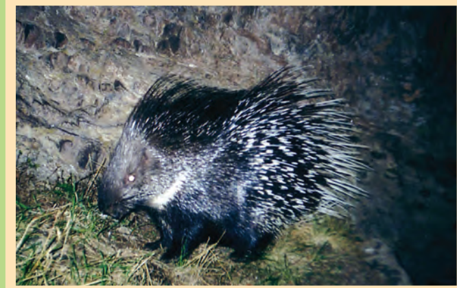
Նիդիական մագաղաթնոց Indian porcupine (Hystrix indica)

«ՈՐՈՏԱՆ» արգելավայր Նախատեսվող տարածքը՝ մոտ 24000 հա, կենրադի «Գորիսի» արգելավայրը Նպատակը՝ Գորիսի տարածաշրջանի բնական էկոհամակարգերի, լանդշաֆտային և կենսաբանական բազմազանության, ինչպես նաև բնության ժառանգության և ռելիեֆային հզորությունների պահպանություն