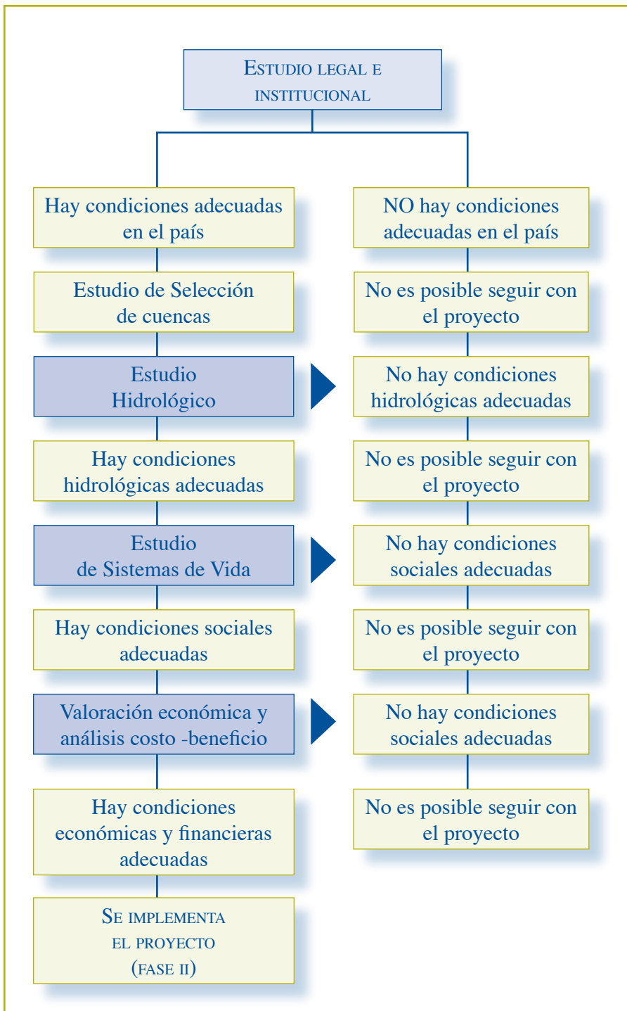
Figura 1. Secuencia de la Fase I del proyecto.