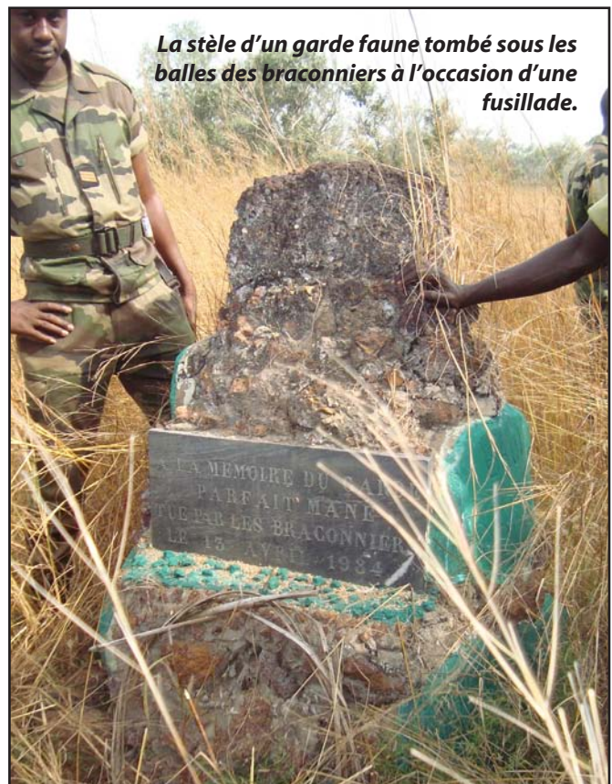
La stèle d'un garde faune tombé sous les balles des braconniers à l'occasion d'une fusillade.

Et la communauté internationale dans tout cela ? Une telle question est loin d'être saugrenue dans la mesure où il est question d'un site inscrit sur la liste du patrimoine mondial en péril depuis 2007 par le Comité du patrimoine mondial. ●