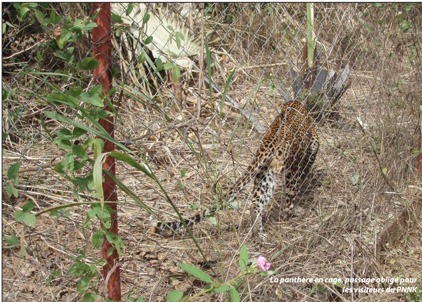
La panthère en cage, passage obligé pour les visiteurs du PNNK

Plus d'un demi-siècle après sa création, le Parc national du Niokolo Koba (Pnkk) est confronté à une régression drastique de ses espèces animales et végétales et était pratiquement sous gestion exclusive de l'administration des parcs. Face à cette situation, aujourd'hui, les stratégies de conservation privilégient l'implication des populations locales dans la gestion de ce patrimoine.