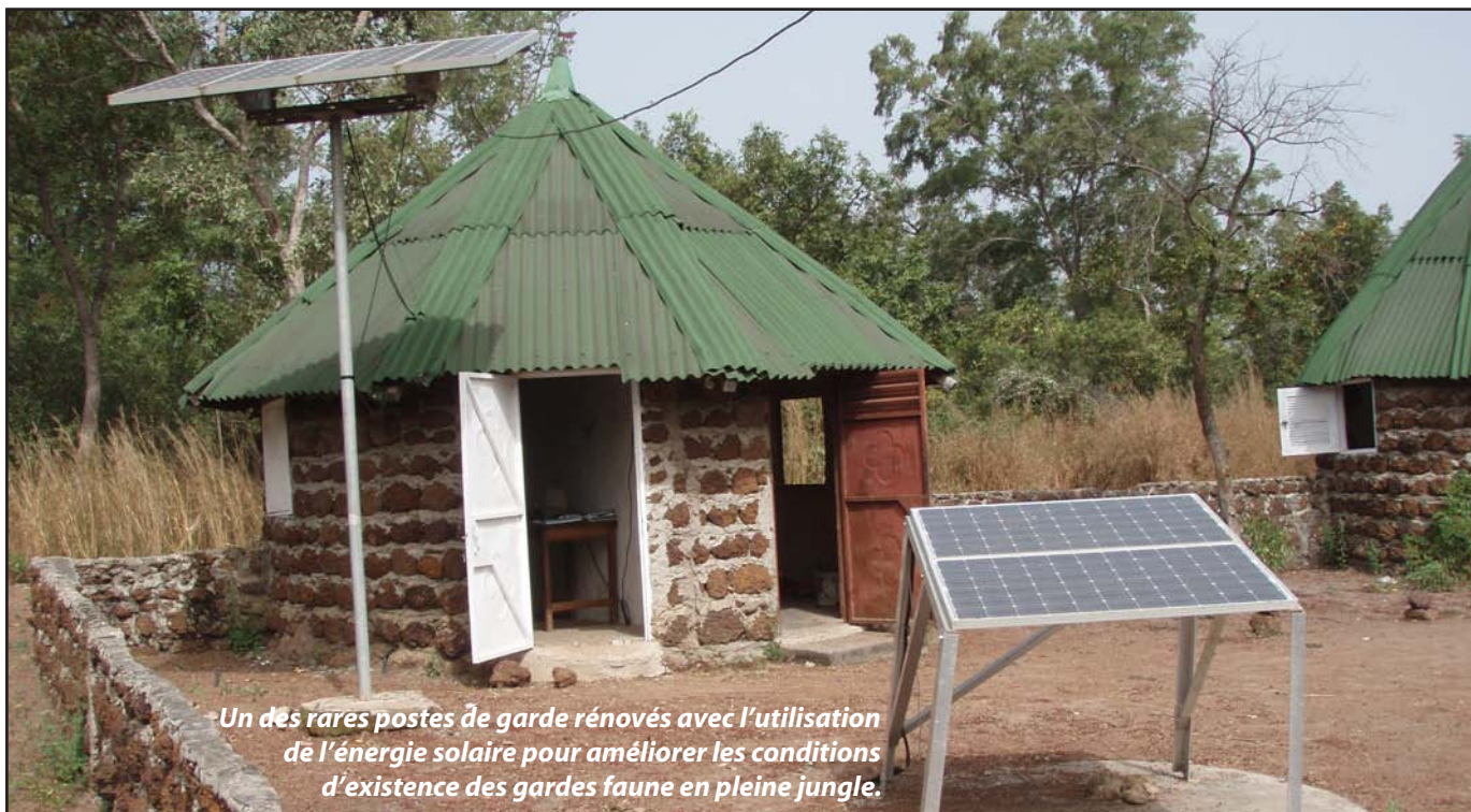
Un des rares postes de garde rénovés avec l'utilisation de l'énergie solaire pour améliorer les conditions d'existence des gardes faune en pleine jungle.

en train de rétrécir et de se transformer en marécage ». En l'absence d'explications scientifiques à ce phénomène apparu au cours des quinze dernières années, aucune des solutions déjà mises en œuvre comme l'arrachage manuel n'ont donné de résultats probants. Et dans les prochaines années, d'autres menaces, notamment liés aux effets du barrage de samba Ngalou, pèsent sur le parc. Selon le Cdt Diémé, « aucune étude d'impact ne nous permet d'avoir des précisions sur le niveau des eaux après la construction du barrage ». Déjà, en saison des pluies, le parc est divisé en deux du fait de l'impraticabilité du Gué de Damantan. « Il risque tout simplement d'être coupé en quatre si les deux affluents de la Gambie, le Niokolo et la Koulountou subissent aussi des changements de régimes hydrologiques ». Cette perspective renforce les craintes quant à une recrudescence du braconnage dans la mesure où le parc polarise un peu plus de 90 000 habitants repartis dans 304 villages et 9 communautés rurales.