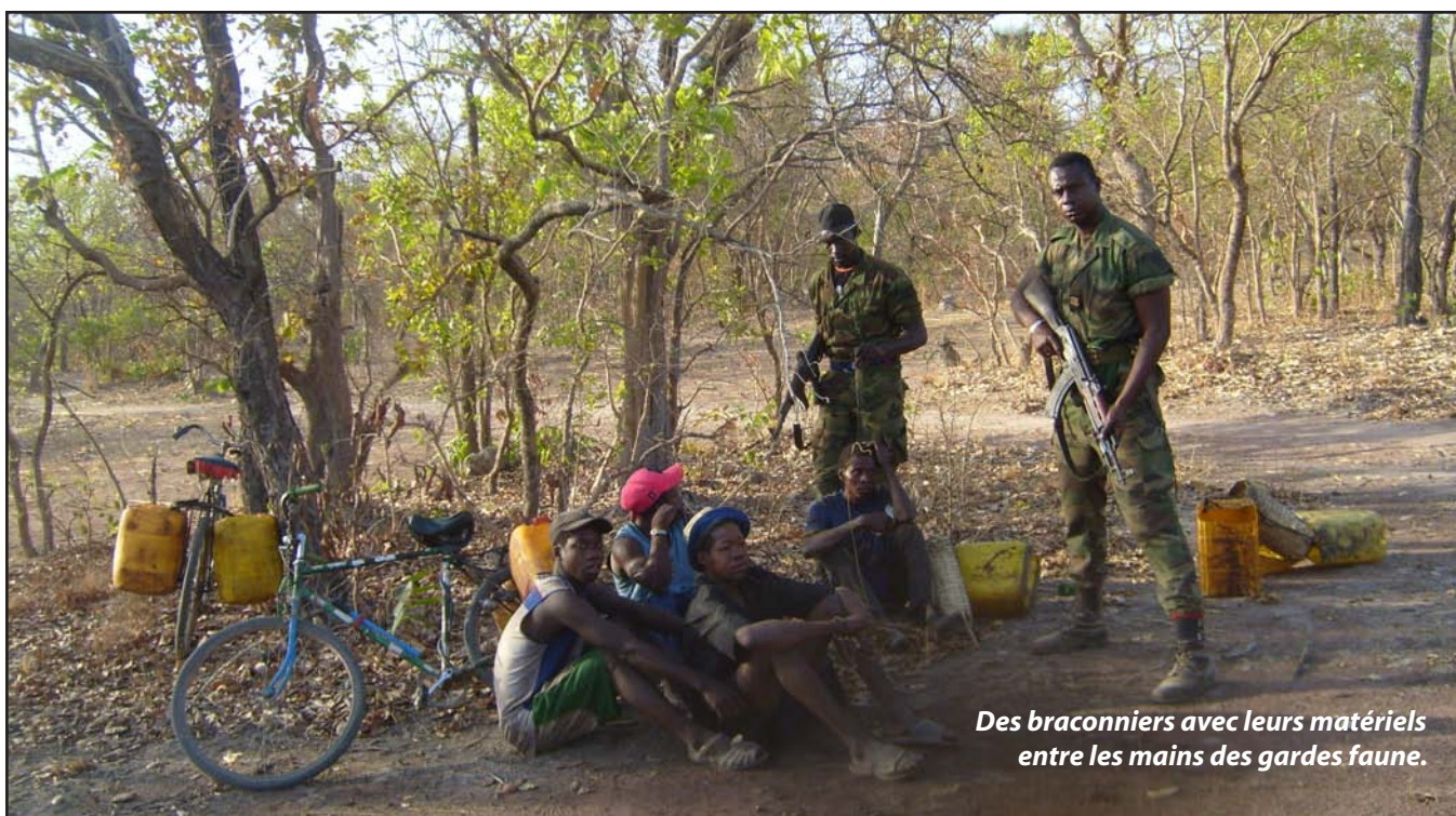
Des braconniers avec leurs matériels entre les mains des gardes faune.

Aujourd'hui, l'heure est à une démarche intégrée. La reconnaissance des communautés comme partie intégrante dans la gestion du parc est venue à son heure. La répression sous tous azimuts a cédé la place à la concertation. Cette nouvelle approche se traduit notamment par l'implication des communautés dans les activités d'aménagement du parc et l'autorisation délivrée à ces dernières pour l'exploitation de certaines ressources comme le bambou, la paille, etc., nécessaires à la construction des cases. En outre, le développement socioéconomique des populations riveraines du parc est aujourd'hui considéré comme fondamental pour une cohabitation harmonieuse. De nouveaux projets et programmes commencent à promouvoir ce développement local. C'est le cas notamment du Programme de gestion intégrée des écosystèmes du Sénégal (PGIES). Ce programme qui intervient dans les localités situées en périphérie des parcs et réserves du Sénégal, tente d'améliorer les conditions de vie de ces populations. A Diénoudiala, village limitrophe du Parc Niokolo Koba, le PGIES accompagne déjà les populations par la mise en place d'une mutuelle d'épargne et le développement du maraîchage pour les femmes. Autant d'activités qui devraient permettre une meilleure cohabitation entre les populations et le parc pour la survie de se dernier. ●