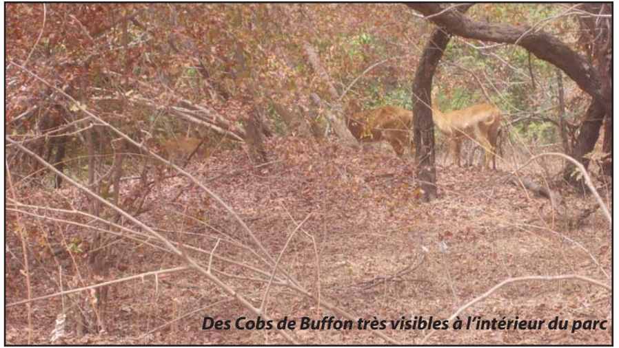
Des Cobs de Buffon très visibles à l'intérieur du parc

Situé au Sud Est du Sénégal, à cheval entre les régions de Tambacounda, Kédougou et Kolda et très proche de la République sœur de Guinée Conakry, le parc national du Niokolo Koba (PNNK), créé en 1954, couvre une superficie de 913.000 hectares s'étendant sur 800 kms de pistes et répartie en trois zones d'intervention (Est, Centre, Nord). Le parc attire l'attention de tous et ne laisse personne indifférente, grâce à son immensité, sa beauté et ses rayons mais aussi la richesse de sa faune notamment la présence du lion et l'éléphant qui ne sont malheureusement très visible au moment où nous passions. L'importance de sa faune et de sa flore composées de toutes les espèces végétales et animales des savanes d'Afrique de l'Ouest et l'essentiel de la biodiversité du Sénégal, avait nécessité le déplacement, dans les années 70, de nombreux villages, afin de créer ce parc qui, aujourd'hui, à cause de l'action de l'homme et l'absence de financements conséquents, est en voie de disparition.