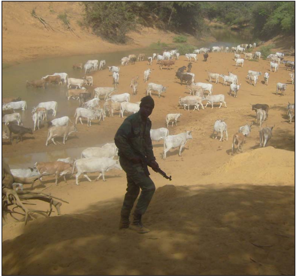
La divagation des animaux domestiques constitue une grave menace pour le Niokolo Koba

Le Sénégal compte un certain nombre de parcs. Mais, la particularité du Parc National du Niokolo Koba (PNNK) réside dans le fait que non seulement il est le plus important du point de sa superficie et de ses richesses fauniques et forestières, mais il est aujourd'hui un patrimoine en péril. Comme une mort lente, le PNNK se dégrade de jour en jour et n'a pas encore les moyens de sa restauration.