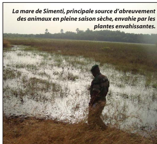
La mare de Simenti, principale source d'abreuvement des animaux en pleine saison sèche, envahie par les plantes envahissantes.

éco-touristique des villageois de Dienoudiala installé au camp du Lion en plein cœur du Pnkk est édifiant. Le vieux Tamba Konté, notable de ce village renseigne que « les recettes générées sont bénéfiques pour le village. Par exemple, lors des grandes fêtes, nous achetons des bœufs pour les partager entre tous les villageois ». Aujourd'hui, l'objectif de faire participer les villageois à la surveillance s'est ancré et beaucoup de villages rejettent à l'image de Dienoudiala toute activité nocive pour le parc, particulièrement le braconnage et l'exploitation clandestine d'espèces à hautes valeurs commerciales comme le Venn ou le bambou. Les villageois ont pris le pari de participer à la conservation pour en recueillir les fruits. Et les retombées sont au rendez-vous avec la mise en œuvre de diverses activités génératrices de revenus mises en place par le Programme de gestion intégré des écosystèmes du Sénégal (Pgies) ou encore le programme de gestion durable et participative des énergies traditionnelles et de substitution (Progede). Il s'agit notamment de la mise en place de fermes d'élevages de pintades mais aussi de forêts communautaires villageoises. ●