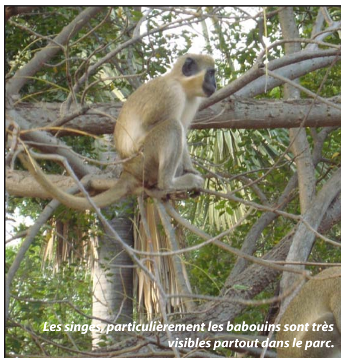
Les singes, particulièrement les babouins sont très visibles partout dans le parc.