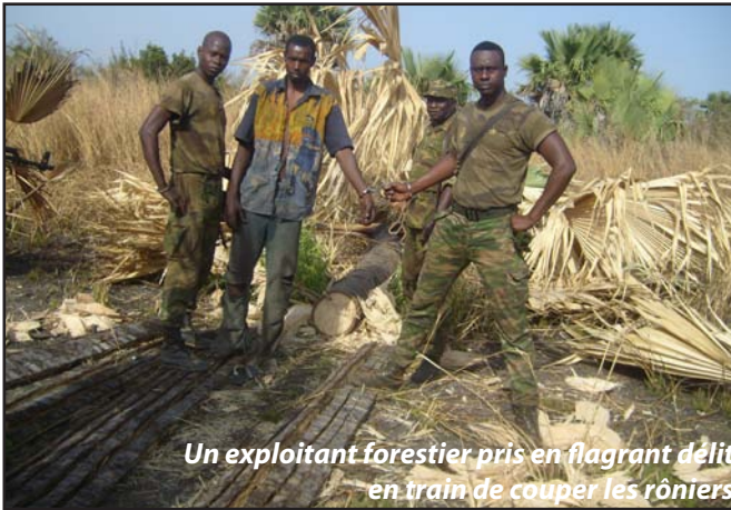
Un exploitant forestier pris en flagrant délit en train de couper les rôniers

Aujourd'hui, force est de reconnaître que ce patrimoine mondial qui est le PNNK est en péril, ce qui fait qu'il urge de tirer sur la sonnette d'alarme pour, non seulement le sauver, mais pour lui permettre de remplir ses missions. Seulement, depuis 2007, le PNNK fait partie des 31 sites inscrits sur la liste du patrimoine mondial en péril du Comité du patrimoine mondial, selon l'article 11, Alinéa 4 de la Convention concernant la protection du patrimoine mondial, culturel et naturel adopté par l'UNESCO en 1972.