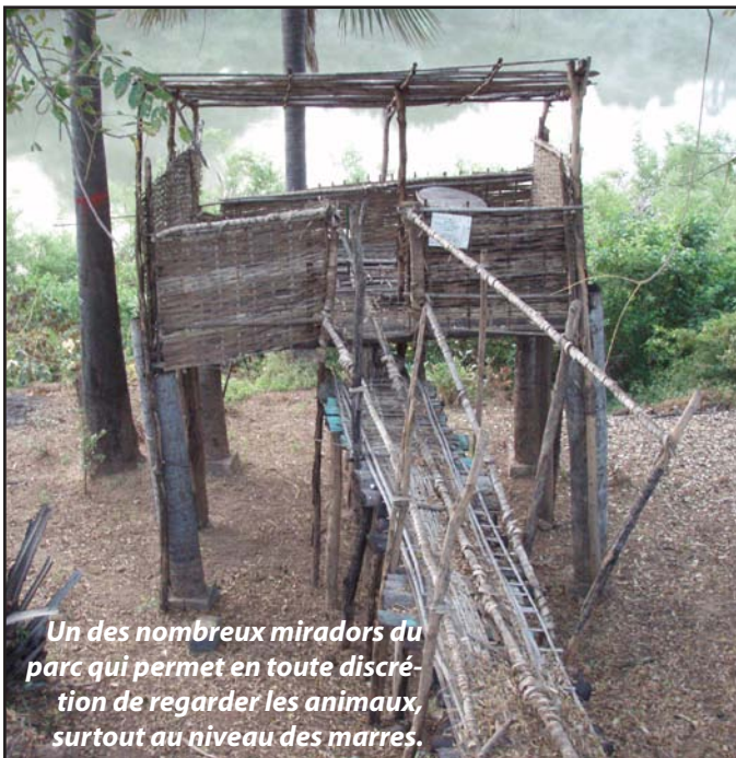
Un des nombreux miradors du parc qui permet en toute discrétion de regarder les animaux, surtout au niveau des marres.

Le Parc national de Niokolo Koba (PNNK), classé patrimoine mondial de l'Unesco depuis 1981, abrite à lui seul 70 % des forêts galeries du Sénégal et donc une grande biodiversité. Suffisant pour qu'il se positionne avec un fort potentiel touristique mais qu'on ne peut exploiter que si l'on fait face aux difficultés de gestion et d'aménagement du parc.