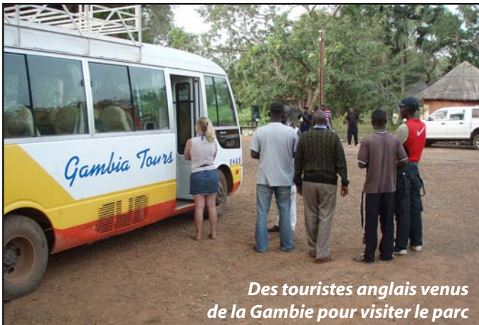
Des touristes anglais venus de la Gambie pour visiter le parc